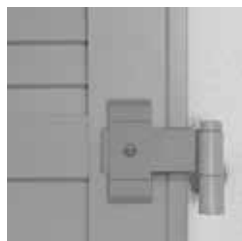
Expressband mit Sicherungsring