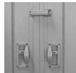
Schieber und Zentralverschluss